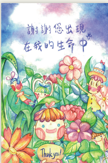
佳作 314 張詩君