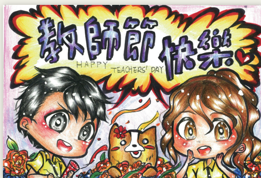
第三名 201 王葦如 繪風細緻、對比強烈、主題明確。