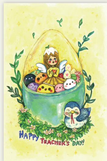
佳作 314 劉逸齡