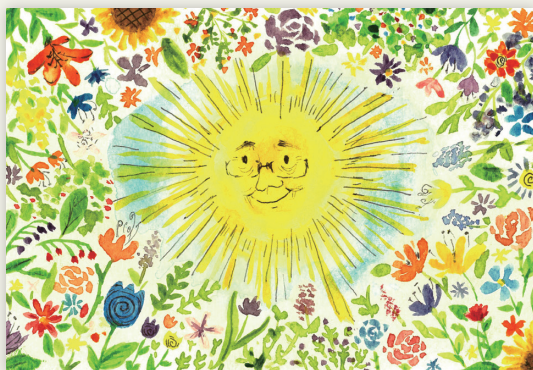
第二名 306 宋采倫 風格活潑、色彩繽紛和諧、符合主題訴求。