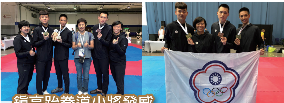
鎮高跆拳道小將發威