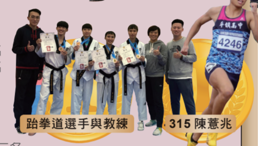
跆拳道選手與教練