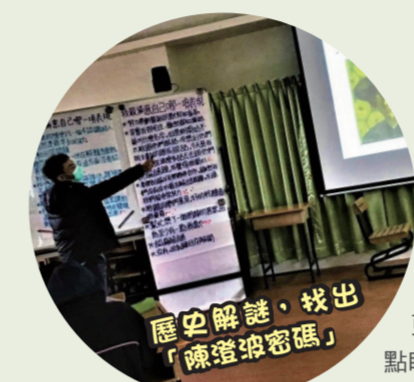
歷史解謎，找出「陳澄波密碼」

享受謎題刺激之際，推理小說的解析認知以及歷史解謎設計應用亦是課程教授的兩大主軸。利用各國不同類型小說文本的導讀，讓學生能運用本格派定義界定小說的類型，同時理解推理小說的構成要素，其中線索的佈置與合理化情節設定令學生驚嘆不已。再者，將歷史元素導入，使文本時代背景、角色設定更為清晰明亮，甚至深化情節內涵，頗收畫龍點睛之效。在核心課程教授外，搭配「鑽石分層」、「弗瑞爾模型」、「T 型分類」等工具應用，使學生更能參與至學習過程，活絡其思維與相互討論氛圍。 任務結束後，鼓勵學生分享和回饋。使用圓形座位安排、小組黑板或布牆的設置以及課後的 Google 表單、Classroom 等，多元媒介的運用，刺激學生不斷能有發表交流契機，亦產生許多巧思和令人眼睛為之一亮回饋。偵探小說線索設計上，「駱駝嗅覺與視覺何者敏銳」的思考，師生討論的熱度延續至課後仍然不絕、同學們課堂分享時會運用「鑽石分層」的概念在時間管理、人際關係與購物消費行為或情緒困擾的原因分析，也會將「弗瑞爾模型」運用在數學、國文、社會等學科筆記上，澄清自己的認知。看到學生將歷史時代器物元素作「T 型分類」時思考脈絡、聽到他們期待每堂謎題，甚至在實境解謎課上躍躍欲試，這些或能體現課程種子已逐漸萌芽於學生的心吧。