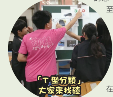
「T 型分類」大家來找碴