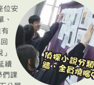
偵探小說分類佈置，全真燒腦的

享受謎題刺激之際，推理小說的解析認知以及歷史解謎設計應用亦是課程教授的兩大主軸。利用各國不同類型小說文本的導讀，讓學生能運用本格派定義界定小說的類型，同時理解推理小說的構成要素，其中線索的佈置與合理化情節設定令學生驚嘆不已。再者，將歷史元素導入，使文本時代背景、角色設定更為清晰明亮，甚至深化情節內涵，頗收畫龍點睛之效。在核心課程教授外，搭配「鑽石分層」、「弗瑞爾模型」、「T 型分類」等工具應用，使學生更能參與至學習過程，活絡其思維與相互討論氛圍。 任務結束後，鼓勵學生分享和回饋。使用圓形座位安排、小組黑板或布牆的設置以及課後的 Google 表單、Classroom 等，多元媒介的運用，刺激學生不斷能有發表交流契機，亦產生許多巧思和令人眼睛為之一亮回饋。偵探小說線索設計上，「駱駝嗅覺與視覺何者敏銳」的思考，師生討論的熱度延續至課後仍然不絕、同學們課堂分享時會運用「鑽石分層」的概念在時間管理、人際關係與購物消費行為或情緒困擾的原因分析，也會將「弗瑞爾模型」運用在數學、國文、社會等學科筆記上，澄清自己的認知。看到學生將歷史時代器物元素作「T 型分類」時思考脈絡、聽到他們期待每堂謎題，甚至在實境解謎課上躍躍欲試，這些或能體現課程種子已逐漸萌芽於學生的心吧。