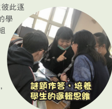
謎題作答，培養學生的邏輯思維

今年高一下學期，我們嘗試以推理小說為素材，結合密室逃脫與實境解謎的概念，設計一門以歷史解謎為表現任務的多元選修課——偵探小說魔法學。 每堂課程的結構設計，大致分為小組任務、課程教授與師生分享、回饋等部分。首先關於分組，透過前三堂課隨機分組，使學生彼此逐漸熟絡，也藉此能得知表現不錯且具領袖特質的學生，使其擔任往後固定分組的組長。分組後，小組任務的設計至為關鍵。每堂課程皆會安排謎題，謎題作答無形中培養學生的邏輯思維，且「諧音、拆字、位移」等謎題類型，亦提供往後課程目標所需的範例與工具。同時，透過小組搶答競賽、靜默書寫等策略，學生逐漸養成集體思考與分工，將邏輯推理、合作表現的視為課程重要環節。