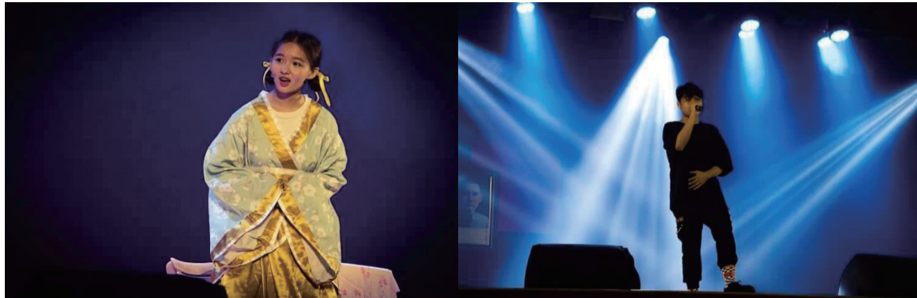
PJ Future Drama Club made a wonderful performance on Freshmen Welcoming Ceremony.

On August 24, 2020, as the curtain opened, the annual PJHS Freshmen Welcoming Ceremony started. Numerous clubs made great efforts to recruit freshmen to join them. They gave lots of impressive performances, such as dancing, singing, acting, instrument playing, etc.