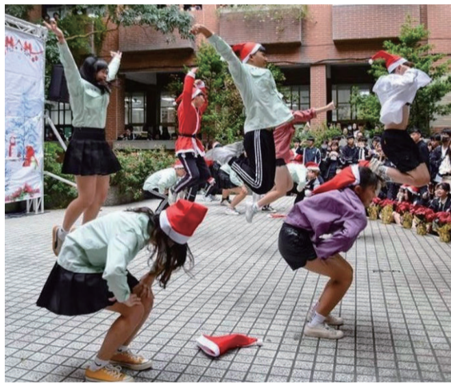
Yulin Recreational Guidance Association gave a brilliant performance on Christmas Week.

For all the freshmen, it was undoubtedly the most unforgettable experience in the beginning of their senior high school life.