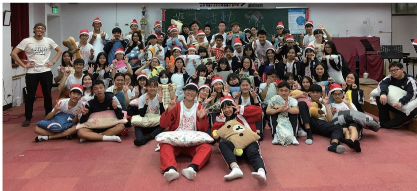
Wind Club members fight with their pillows.

Wind Club members held Christmas activities to celebrate Christmas in our orchestra room on Christmas Eve.