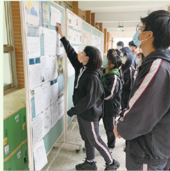
▲學習成果發表與組間互評