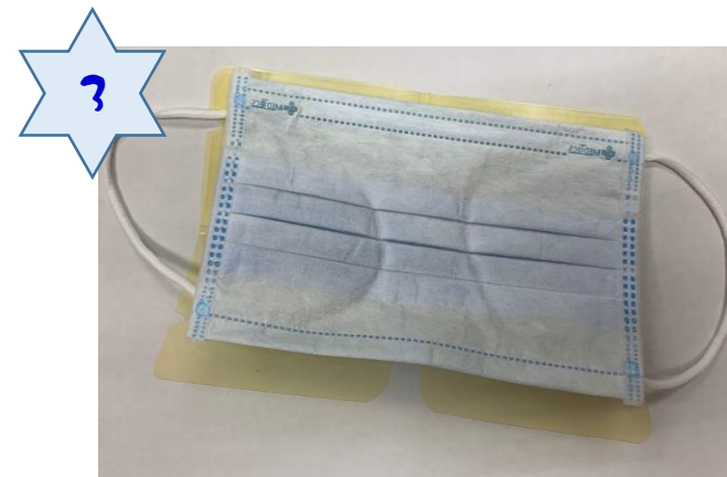
將口罩”污染面”貼住/放置口罩夾