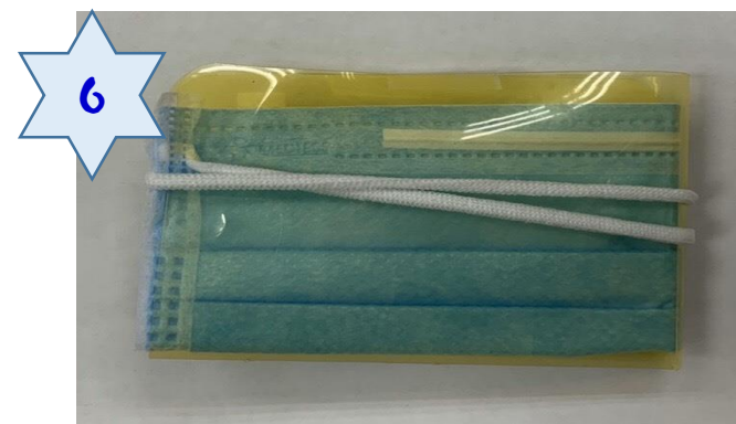
綁好耳掛即可放入口袋