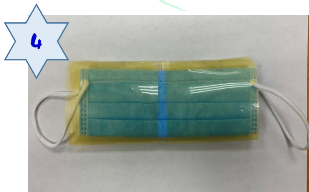
對折(記得耳掛處必須露出)