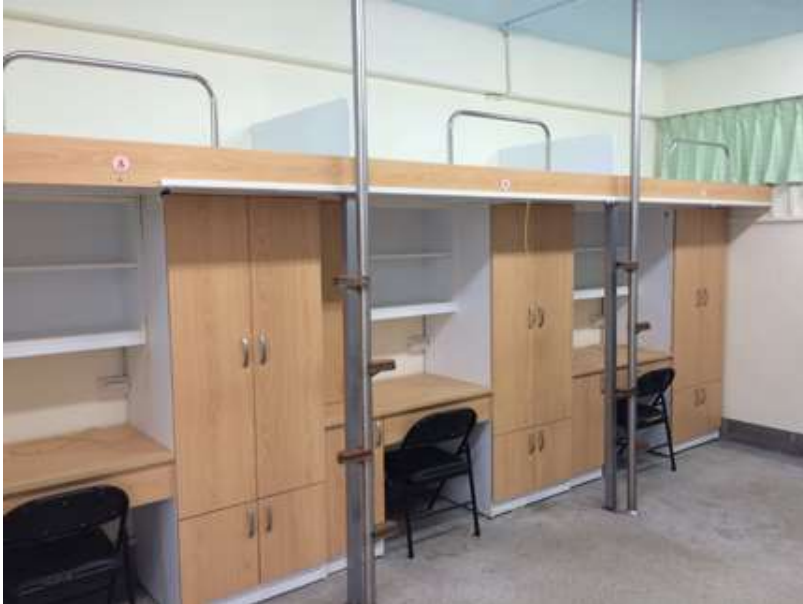
臺北大學學生宿舍