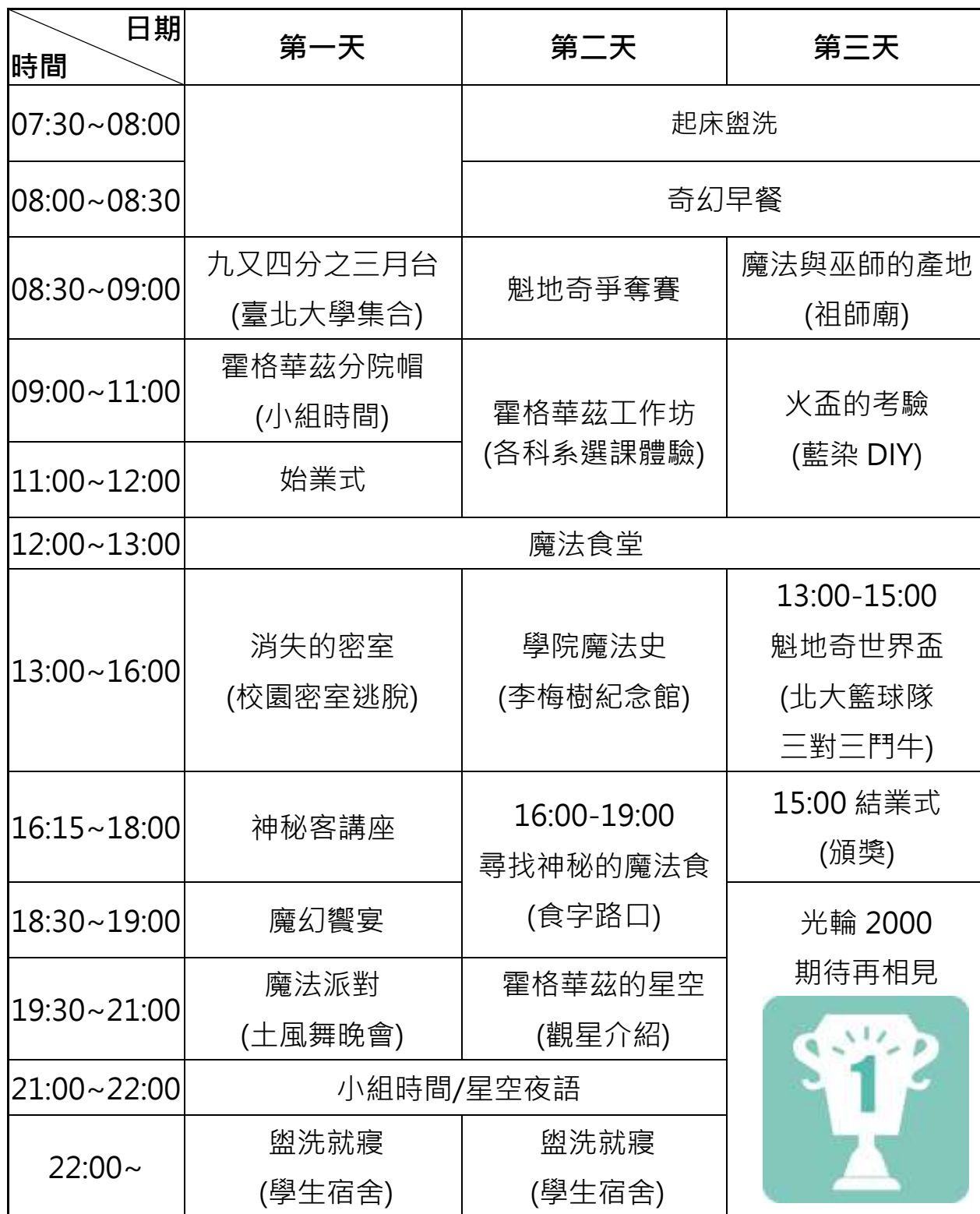
「臺北大學霍格華茲魔法營」流程表