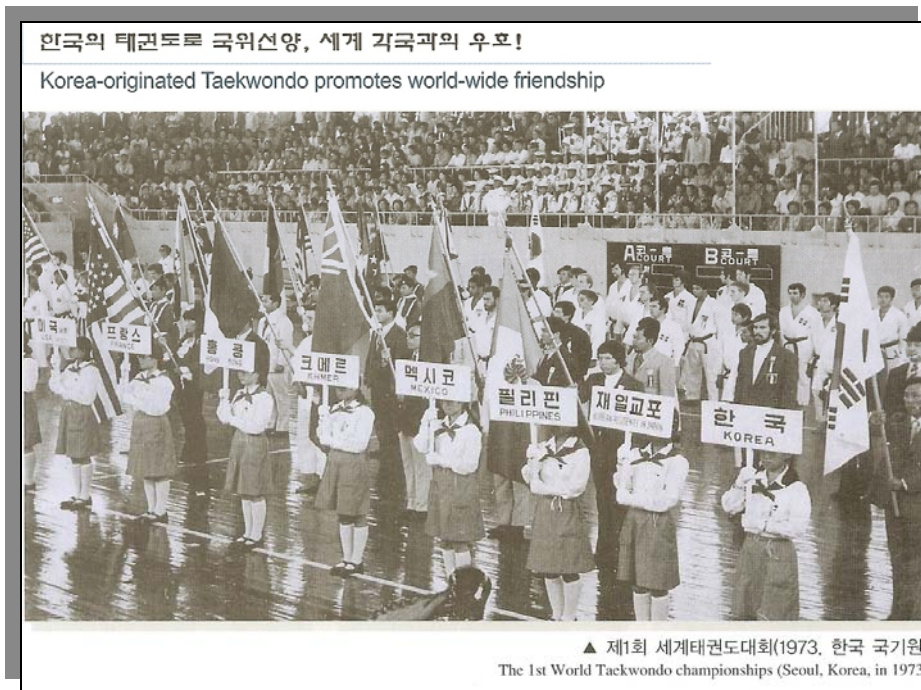
圖二 第一屆世界跆拳道錦標賽

63 公斤以下級與 63 公斤以上級，5 人依序下場比賽，3 人勝出就獲得勝利，台灣代表隊獲得團體第三名。1975 年第二屆漢城世錦賽制修正為 8 個量級，本次比賽開始採用護具，護具內安置竹片若干，作為安全防護。本次比賽，我代表隊比賽成績晉升團體第二名。